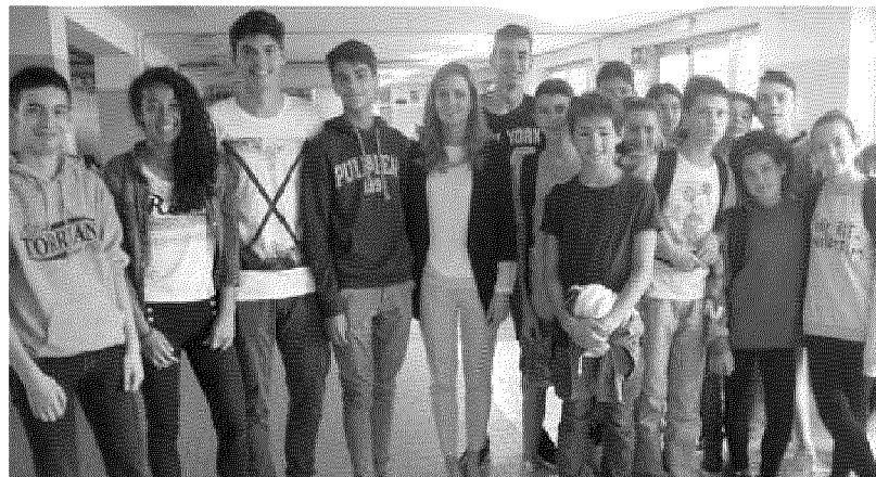
Settanta studenti delle scuole medie