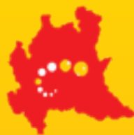
Consulta Regione Lombardia